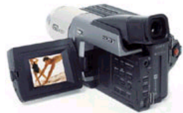
Una telecamera che adotta come sensore il CCD

La camera CCD appare come una scatoletta con una piccola finestra trasparente, dentro la quale è posizionato il chip CCD. Questo